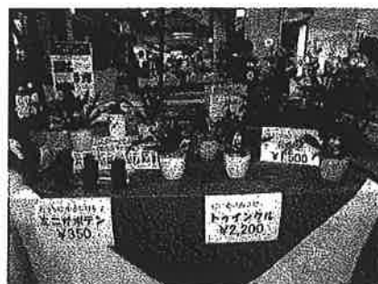
ナイスハートバザール